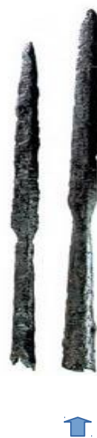
Lantza puntak. Aldaieta.

Nire asmoa IX. mendeko baskoien armada zerrenda osatzea da; horretarako hainbat nekropolitan aurkitutako armamentuan oinarritu naiz; batez ere Arabako Aldaieta (VI.-VII. mende bitartekoa), San Pelaio (VI.-VII. mende bitartekoa) eta San Martin Dulantziko nekropolietan (K.a. II. K.o. IX. mende bitartekoa); Bizkaiko San Martin Finagakoan (VI.-VII. mende bitartekoa); eta Nafarroako Buzaga (VI.-VII. mende bitartekoa) zein Kondestablearen etxea deritzon (VI.-VII. mende bitartekoa).