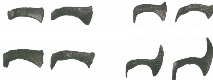
↑ Aizkora buruak. Aldaietako nekropolia.

Ezpatei dagokienez, aho bakarreko ezpata labur asko, scramasax (sax) deiturikoak agertu dira ia aztarnategi guztietan, garai hartan Europa osoan guztiz ohikoak zirenak. Era berean aho biko zein aho bakarreko ezpata luzeak ere aurki daitezke, hain ugariak ez badira ere. Ezpata hauen jatorriari dagokionez zera esan daiteke; garai haietarako ba omen zegoen metalurgia aktibitatea inguruotan, Trapagaranen adibidez (3), hortaz, oso liteke arma hauek bertan egin izana.