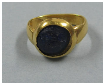
↑ Urrezko eraztuna. Dulantzi (Araba).

Azkena Gran Atlas histórico de Euskal Herria liburutik eskuratutakoa da (8):