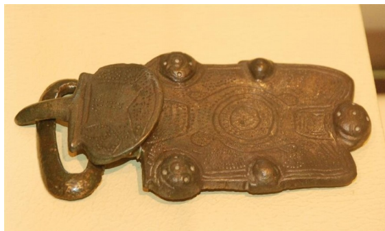
↑ Gerriko belarria. Aldaietako nekropolia.

"Barduloek zaldizko infanteria laguntzaile cohorte bat osatu zuten, zeina Ingalaterrako iparraldean dokumentaturik dagoen, Northumberland-eko Hihg Rochester-en, hain zuzen ere. K.o. III. mendeko inskripzioetan I Fida Vardollorum Equitata bezala deritzona".